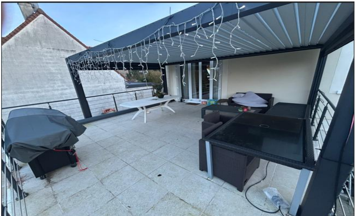
PHOTO D'ENSEMBLE AVANT TRAVAUX

Pose de carrelage extérieur , surface 38 m2 Pose plinthe extérieur 4 mètres Joints